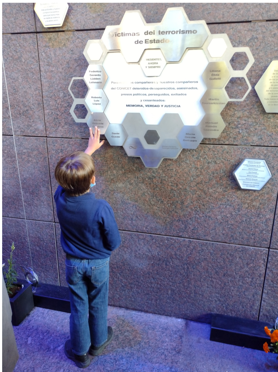
24 de marzo de 2022.